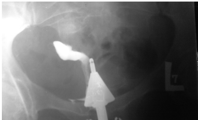
Rycina 1. Róg prawy macicy. Macica dwurożna dwuszyjkowa. Badanie HSG w dniu 05.02.1991 r.

W dniach 28.01.–08.02.1991 roku pacjentka była hospitalizowana celem diagnostyki schorzenia ginekologicznego (wtórnego braku miesiączki). W tym czasie, za zgodą pacjentki, wykonano badanie histerosalpingograficzne macicy: rogu prawego – w dniu 05.02.1991 r. (Ryc. 1), rogu lewego – w dniu 07.02.1991 r. (Ryc. 2). Badanie było wykonane celem udokumentowania wady macicy.