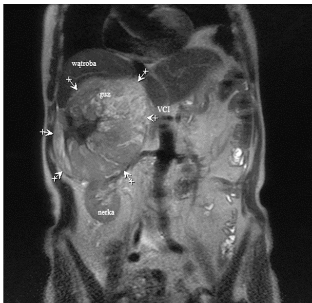
Rycina 2. Badanie MR jamy brzusznej, obraz T2-zależny w płaszczyźnie czołowej. Duży guz prawego nadnercza (oznaczony strzałkami), powodujący ucisk na wątrobę, prawą nerkę, przemieszczający żyłę główną dolną (VCI)